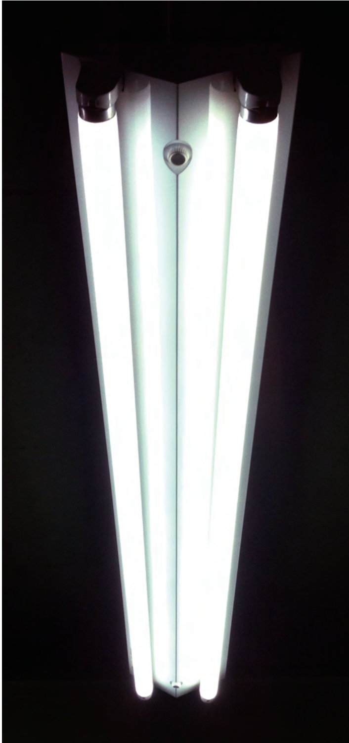
弊社製品：Le:dim- S32W Type 型番：SFL1198-T8-K52-36V 外形寸法：管径 25.5mm 管長 1,198mm 照射角度：300℃

左右も LED 蛍光灯で消費電力も、色（温度）もサイズも同じものです。メーカーが違うだけなんですけど、これだけの“違い”が出ます。その差は「照射角度（配光範囲）」の差。“300℃”という広配光を実現させることによって、より広い範囲に光が届き、明るく室内を照らします。既存蛍光管を置き換えても違和感がほとんどありません。